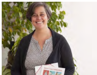
Margalida Castells Souvenir Edicions

Celebra tu árbol es una empresa que trata de vincular el cuidado del medio ambiente con el trabajo en equipo y potenciar las relaciones entre los empleados. Su objetivo principal es la reforestación de la ciudad, espacios públicos y privados, donde se puede participar activamente sin tener que desplazarte de tu comunidad.